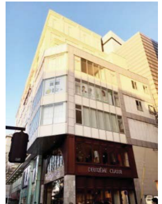
名古屋市中区栄3-30-28 岩田サカエビル5F